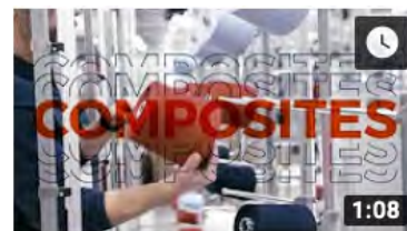
French TEX - Episode 3 : Une grande diversité d'acteurs