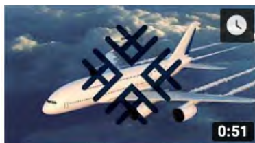
French TEX - Episode 2 : 11 domaines d'application