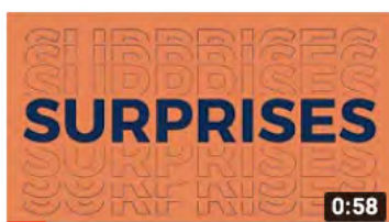
French TEX - Episode 1 : Le textile va vous surprendre

Les vidéos témoignent de la richesse de l'industrie textile française au travers de la diversité de ses acteurs, de leur capacité à innover et de la variété des métiers proposés. Elles sont disponibles sur la chaîne Youtube officielle.